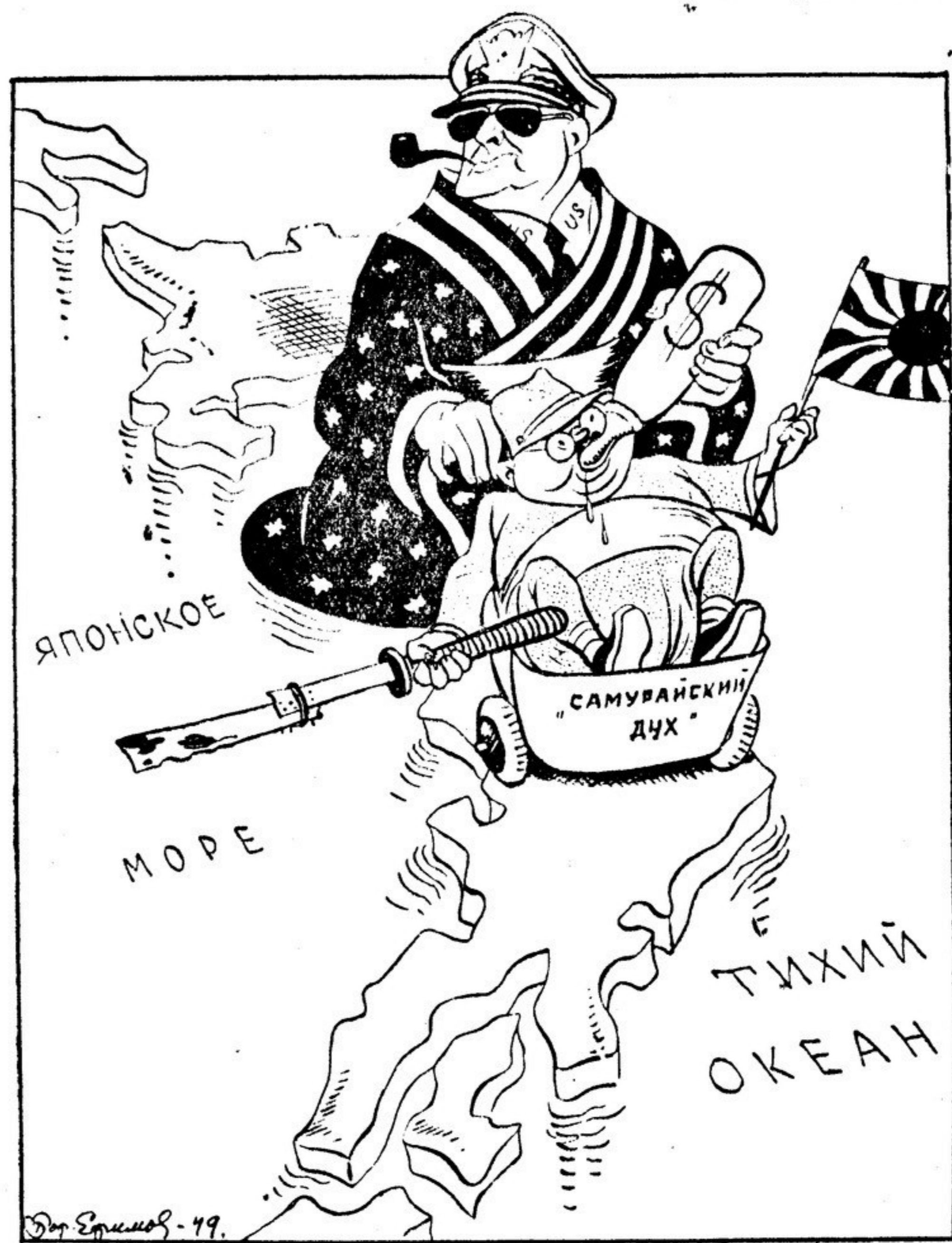
Рис. Бор. ЭФРИМОВА.